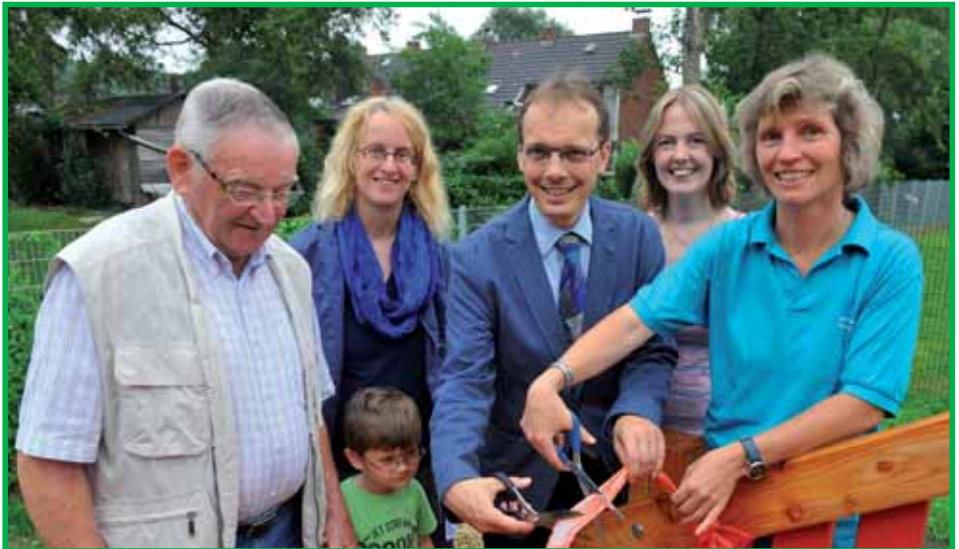
Eröffnung der Erweiterungsfläche