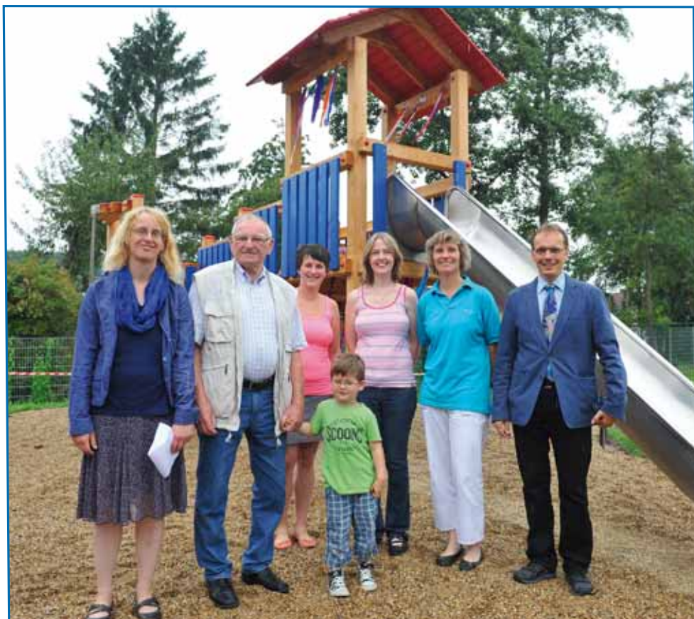
Eröffnung der Erweiterungsfläche an unserem Kindergarten mit neuem Spielgerät am 25. Juli 2014