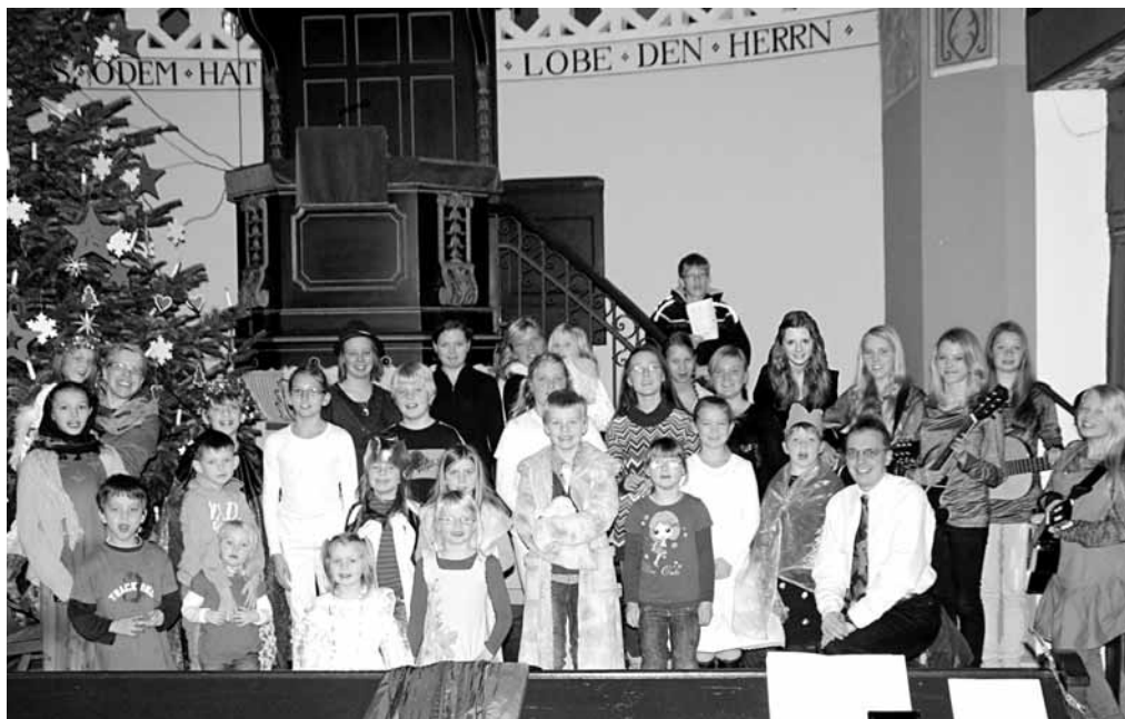
Die Kinder und Mitarbeitenden vom Kindergottesdienst bei der Generalprobe für das Krippenspiel 2012

Evangelisch-reformierte Kirchengemeinde Borssum