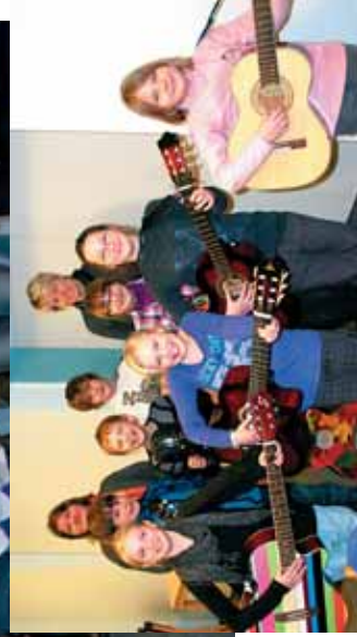
Die Seitenhüpfen beim fröhlichen Üben!