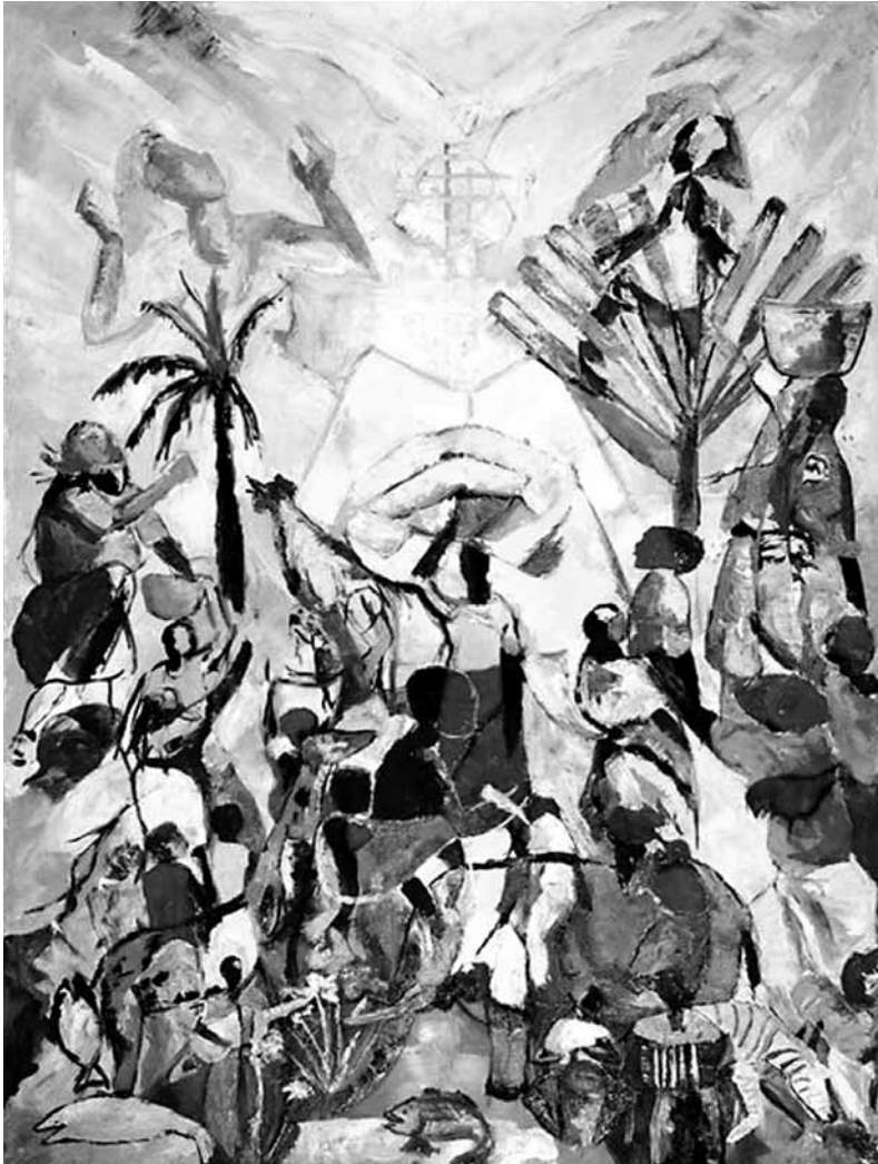
Frauen aller Konfessionen laden ein

Hilmarsum 18.50 Uhr, Liekeweg 18.52 Uhr, Ulmenstr. 18.53 Uhr, Neukauf 18.54 Uhr, Wilhelm-Leuschner Str. 18.55 Uhr.