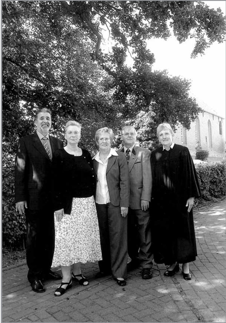
Goldene Konfirmation in Jarssum am 13. 07. 2008