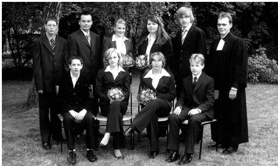
Konfirmationen in Borssum am 18. und 25. Mai 2008