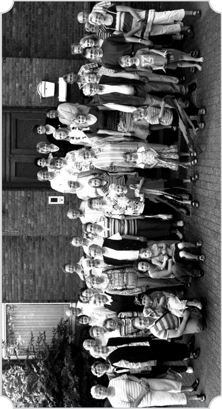
Mitarbeitergrillen am 6. Juni 2008

Auf die Seite mit den Adressen haben wir in dieser Ausgabe zu Gunsten des Photos verzichtet. Wenn Sie eine Telefonnummer zu den einzelnen Kreisen suchen, rufen Sie im Pfarrhaus an (954030). Vielen Dank