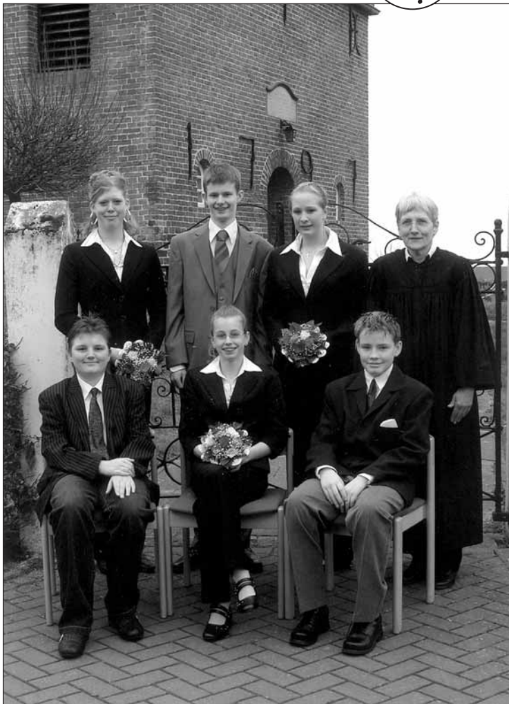
Konfirmation in Jarssum 2008